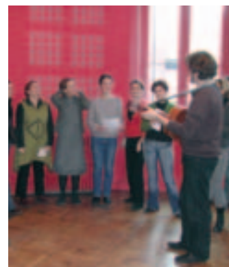
Répétition de la chorale polyphonique

En mai 2006, le Tribunal de Grande Instance valide le plan de continuation de la structure. Il entérine le montant de la dette et propose de l'étaler sur 10 ans en accord avec l'ARA. Quelques dettes sont tout de même à payer tout de suite nous indique la directrice : "Dès la sortie de la période d'observation, nous devons rembourser immédiatement l'AGS (Association pour la gestion du régime de Garantie des créances des Salariés) qui avait pris le relais sur le paiement des salaires du 1er au 9 septembre et avait pris en charge les frais liés aux licenciements.