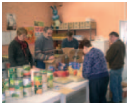
Les bénévoles d'Espace Solidarité Hellemmes